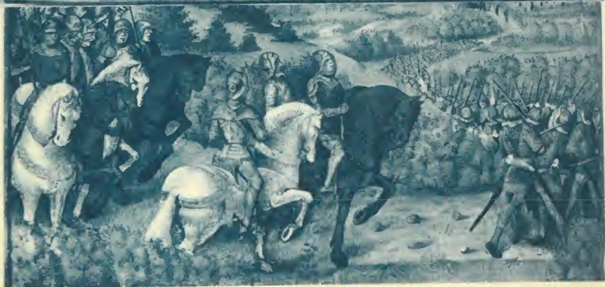
COMMENT LE FER DE LANCE DE N. S. FUT TROUVÉ A ANTIOCHE, DONT TOUS LES PÈLERINS SE PRIRENT FORCE ET COURAGE ET CONCLURENT ALLER COMBATTRE